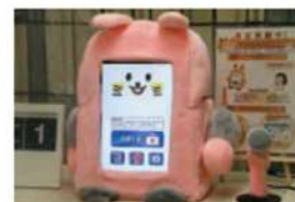
品川区本庁舎3階総合案内横、第二庁舎3階入口に2台試験導入

現在、多くの問合せを頂いており、今後も問合せの継続が期待されます。既に京都大学とNPO法人による子育て支援用としてロボコットを導入いただいております。また、AIロボットで、労働力不足やウイルス対策へ貢献するとともに、発注面でも貢献を図りたいと考えます。AIロボットは多種多様な部品、ツール等が組み込まれており、AIロボットの導入拡大は、発注拡大へも繋がります。こうしたAIロボットの特性を活かし、品川区の発展に寄与できるように頑張っております。